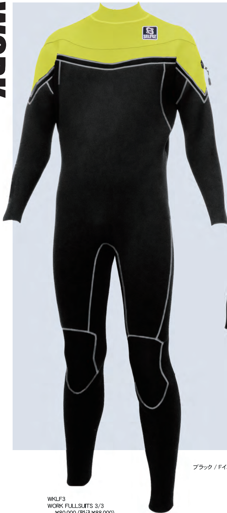
WKLF3 WORK FULLSUITS 3/3 ¥80,000 (税込¥88,000)