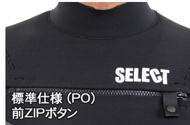
標準仕様 (PO) 前ZIPボタン