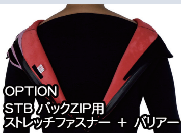
OPTION STBバックZIP用 ストレッチファスナー + パッチ