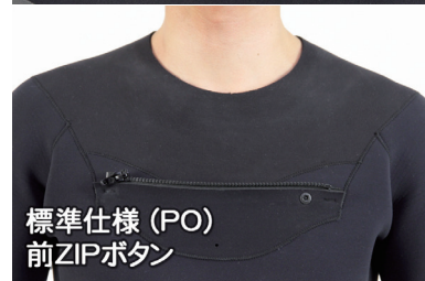
標準仕様 (PO) 前ZIPボタン