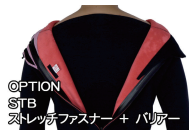
OPTION STB ストレッチファスナー + バリアー

標準仕様 ひざパット5mmタフジャージ 手首・足首切りっぱなし 胸ワッペン:(1・2・3・4)選択可能