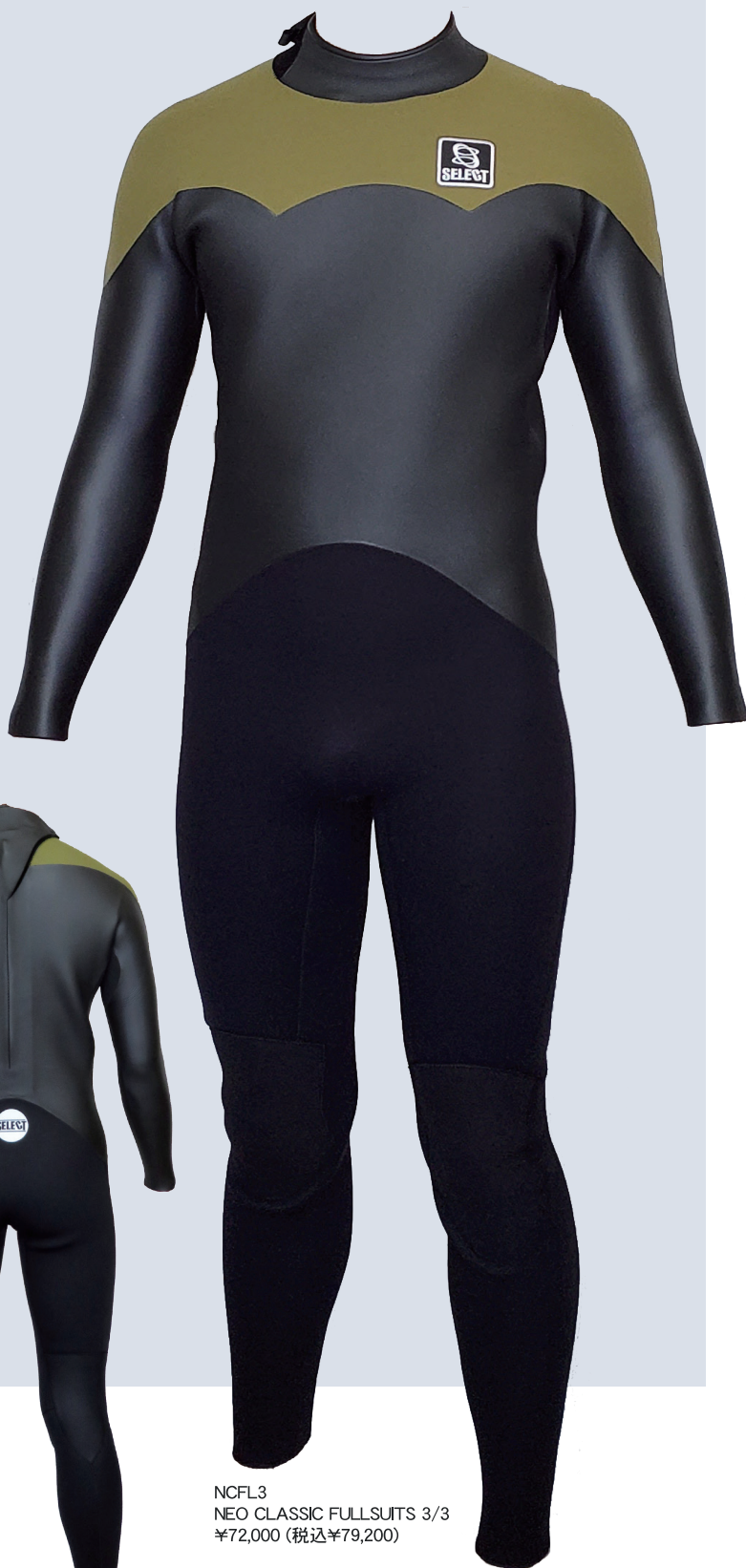
NCFL3 NEO CLASSIC FULLSUITS 3/3 ¥72,000 (税込¥79,200)