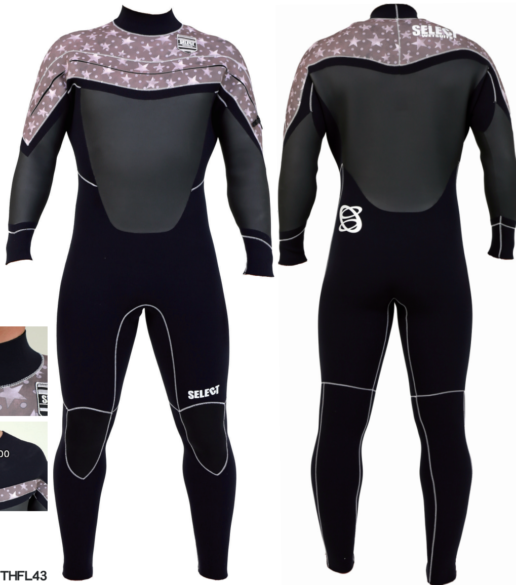
THFL43 T-HOLE FULLSUITS 4/3 ¥80,000 + デザインジャージ オプション ¥4,000