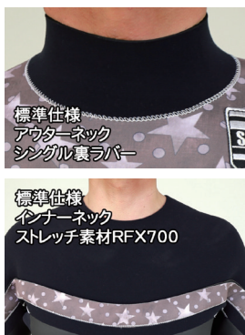
標準仕様 アウターネック シングル裏ラバー