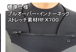
標準仕様 プルオーバー・インナーネック ストレッチ素材RFX700