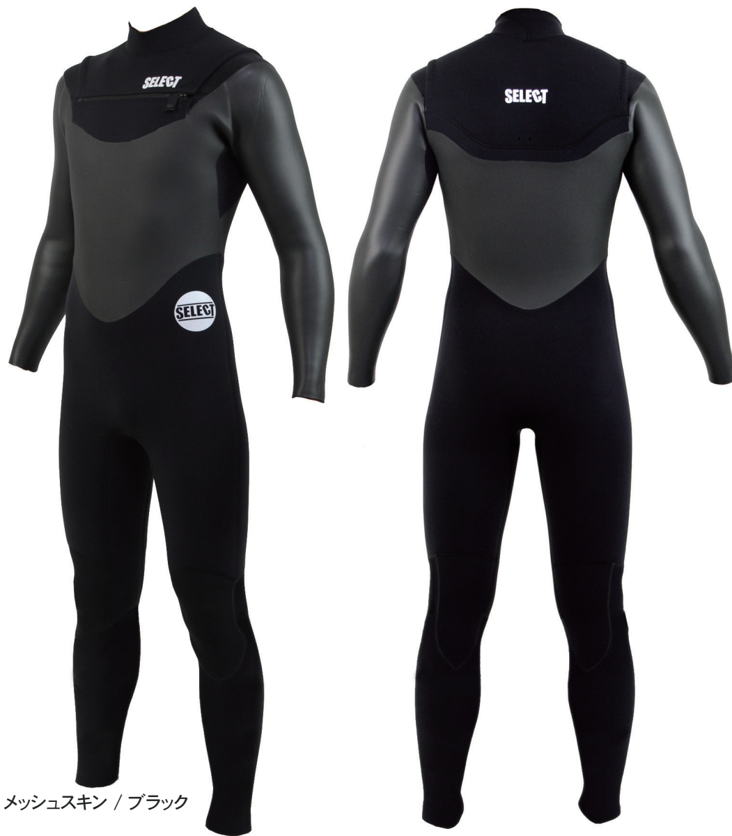
メッシュスキン / ブラック