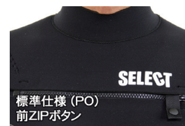
標準仕様 (PO) 前ZIPボタン