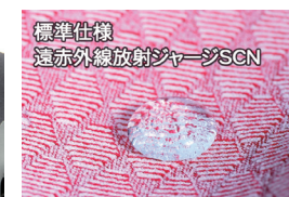
標準仕様 遠赤外線放射ジャージSCN