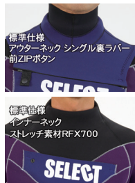
SBLFL43 SLANT BALLOON FULLSUITS 4/3 ¥85,000 プラムバイオレット / ダークブルー

SLANT BALLOON(スラント バルーン)はBALLOON FWにプルオーバーフラップを付けました。最高の運動性と伸縮性を兼ね備え、遠赤外線放射ジャージSCNIにより、保温性、速乾性もプラスしたネックエントリー・ウェットスーツです。ネック、脇下に伸び率約700%のストレッチ素材(RFX700)を使用することでストレスの無い着脱を可能にしました。ZIPのリリースを防止するため、ZIPボタンを採用しました。首と手首はシングル裏ラバーにすることで、水の浸入と圧迫感を軽減しています。ラバー折り返しハイネックはオプションで設定可能です。ワッペン:(1・2・3)選択可能。