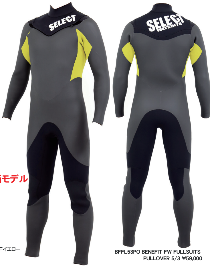
ブラック / ファイエロー