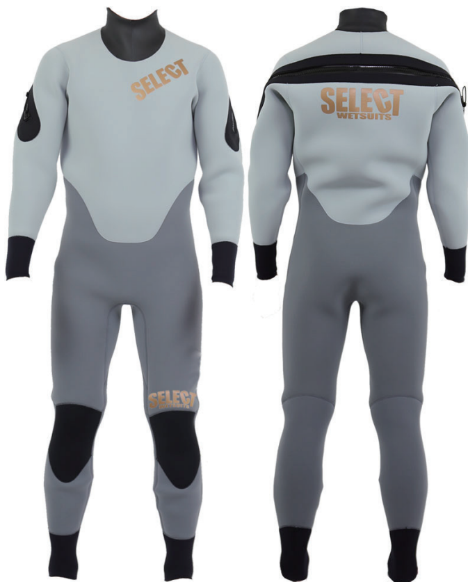
ARFL44 ARC FULLSUITS 4/4 ¥106,000 ライトグレー / ミディアムグレー