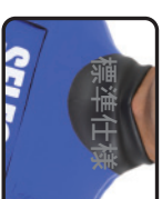
フトラップ装着時