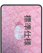
遠赤外線放射ジャージSCN