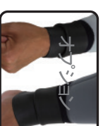
手首・足首ウィール