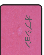
SSP SCN-SP 遠赤起毛