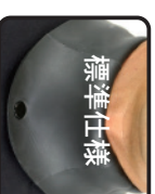
秋冬用ネットカパー