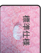
遠赤外線放射ジャーシヤージSCN