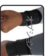
手首・足首ウィール