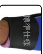
手首シングル裏ラバー