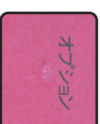
SSP SCN-SP 遠赤起毛