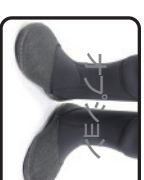
ソトラジアルブーツ 5mm