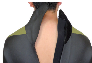
標準仕様 バックファスナー

NCFL3 NEO CLASSIC FULLSUITS 3/3 ¥74,000 (税込¥81,400)