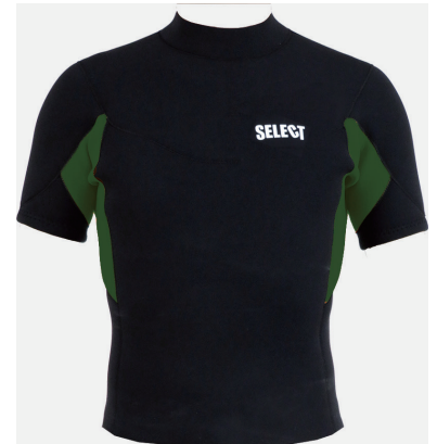
BFSTP BENEFIT S/Sタッパー ¥31,000 (税込¥34,100)

標準仕様 インナーネック: ストレッチ素材RFX700 ひざパット5mm タフジャージ ※マークカラー『ブラック』、ワッペン使用不可。 ※マーク位置の変更はできません。