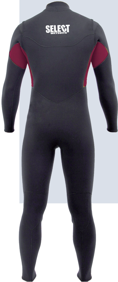
ブラック / ワイン